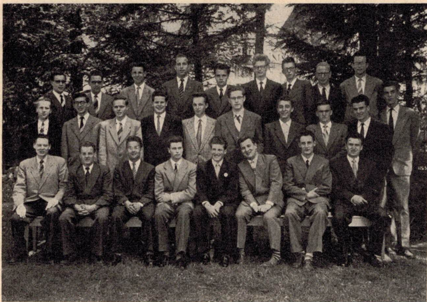
Maturanden von 1956